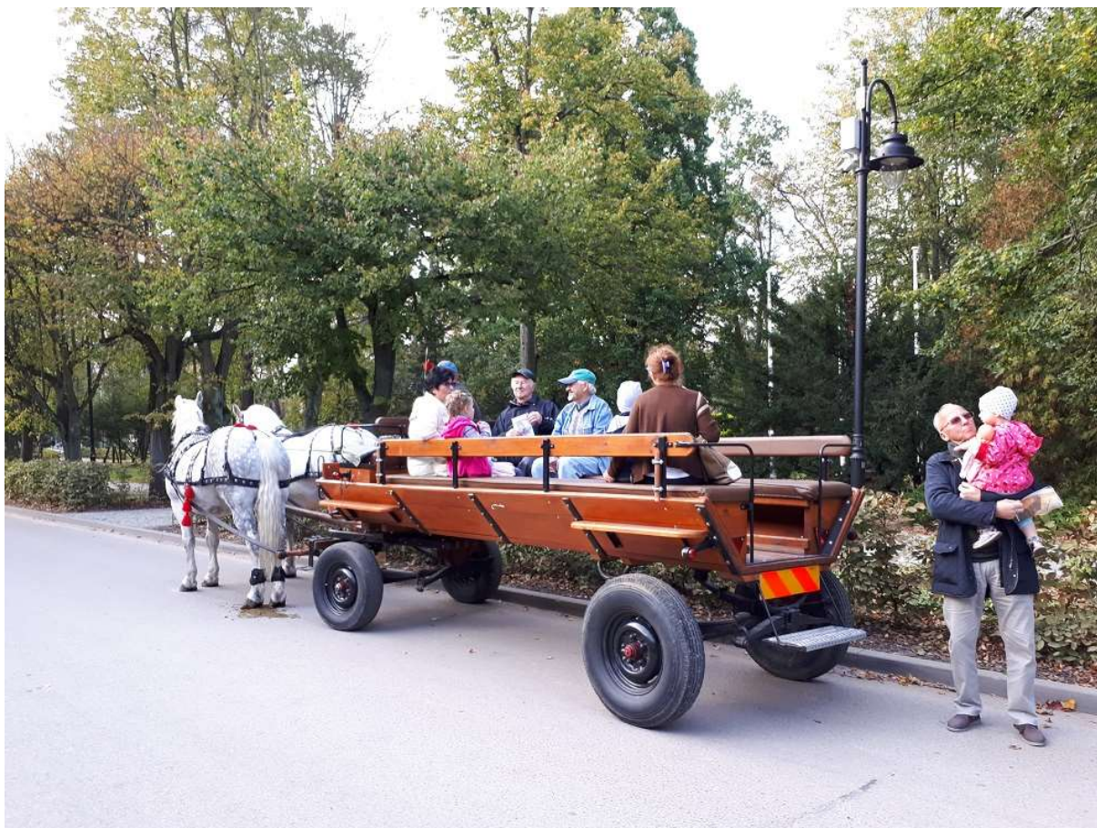
Rysunek 2. Uczestnicy konsultacji przed rozpoczęciem objazdu