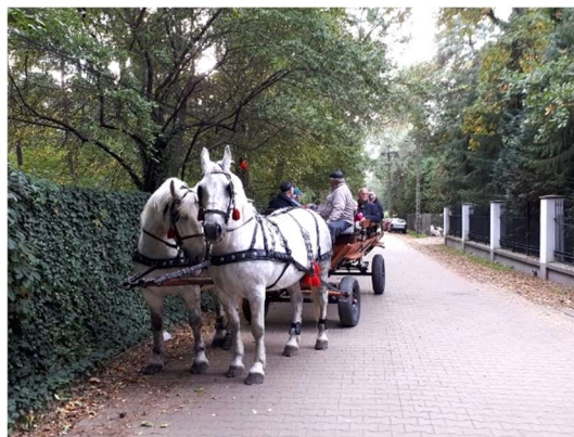
Rysunek 3 i 4. Uczestnicy konsultacji w trakcie trwania objazdu

Objazd miasta pozwolił uczestnikom konsultacji spojrzeć na Podkowę Leśną z innej, nowej perspektywy. Mieszkańcy opuścili na chwilę wymiar codziennych doświadczeń by wcielić się w rolę turystów. Dzięki opowieściom przytaczanym przez przewodnika poznali genezę powstawania całego miasta i poszczególnych przestrzeni, z których na co dzień korzystają. Ujrzeli Podkowę w szerszej skali. Droga, którą codziennie pokonują udając się do pracy, czy park, w którym spędzają wolne popołudnia, przestały być tylko przestrzeniami ich codziennej aktywności. Stały się elementem większej, pieczołowicie zaplanowanej całości. Całości tworzącej tożsamość lokalną i unikalny charakter miejsca. Zapisy nowego Studium muszą zapewniać ochronę stanu istniejącego przy jednoczesnym stworzeniu warunków do lepszego wykorzystania walorów miasta.